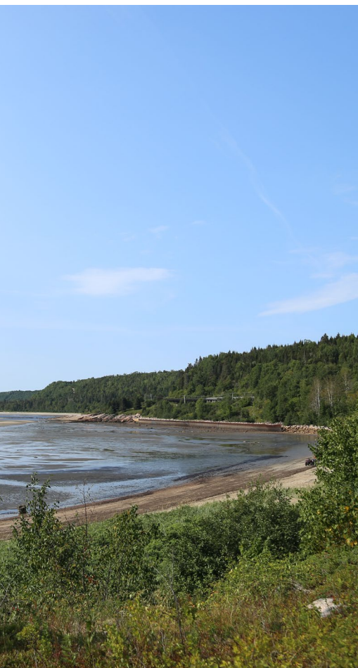
Vue sur le fleuve — Sabrina Gagné

Corporation de développement touristique de Forestville